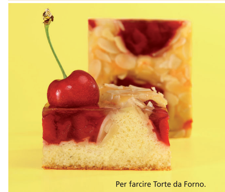
Per farcire Torte da Forno.