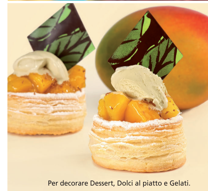
Per decorare Dessert, Dolci al piatto e Gelati.