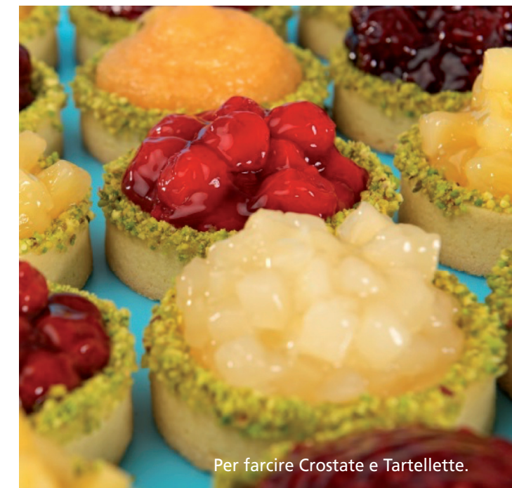
Per farcire Crostate e Tartellette.

Il logo "All natural flavours" contraddistingue l'utilizzo esclusivo di questi aromi in tutte le formulazioni che lo riportano!