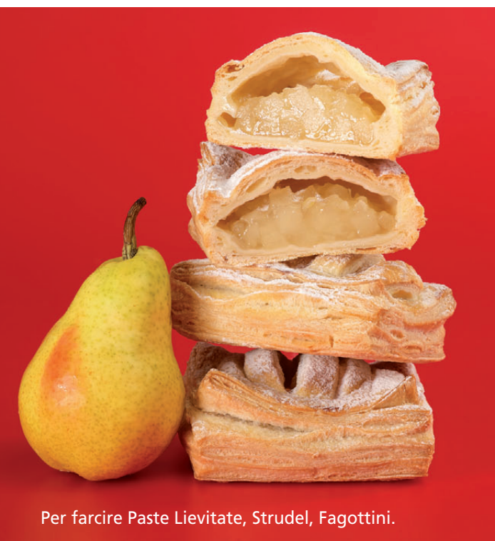
Per farcire Paste Lievitate, Strudel, Fagottini.