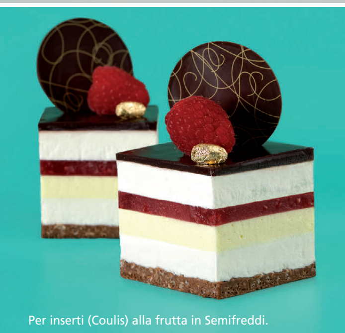
Per inserti (Coulis) alla frutta in Semifreddi.