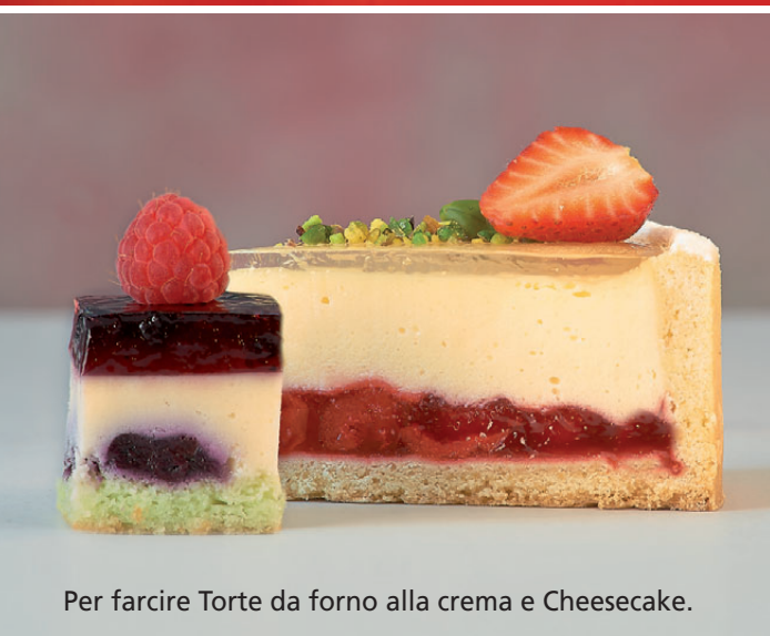
Per farcire Torte da forno alla crema e Cheesecake.